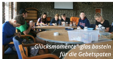
„Glücksmomente“-glas basteln für die Gebetspaten