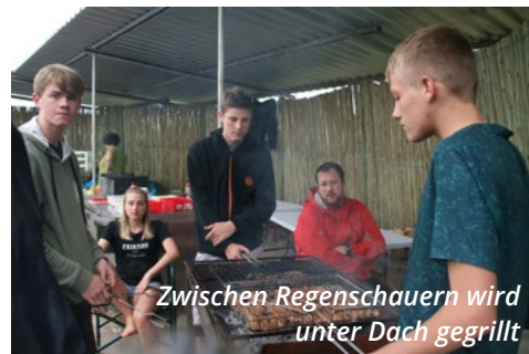
Zwischen Regenschauern wird unter Dach gegrillt